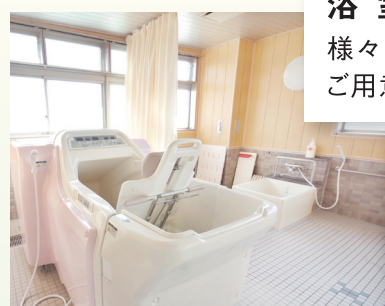
浴室 様々なタイプの浴槽をご用意しています。