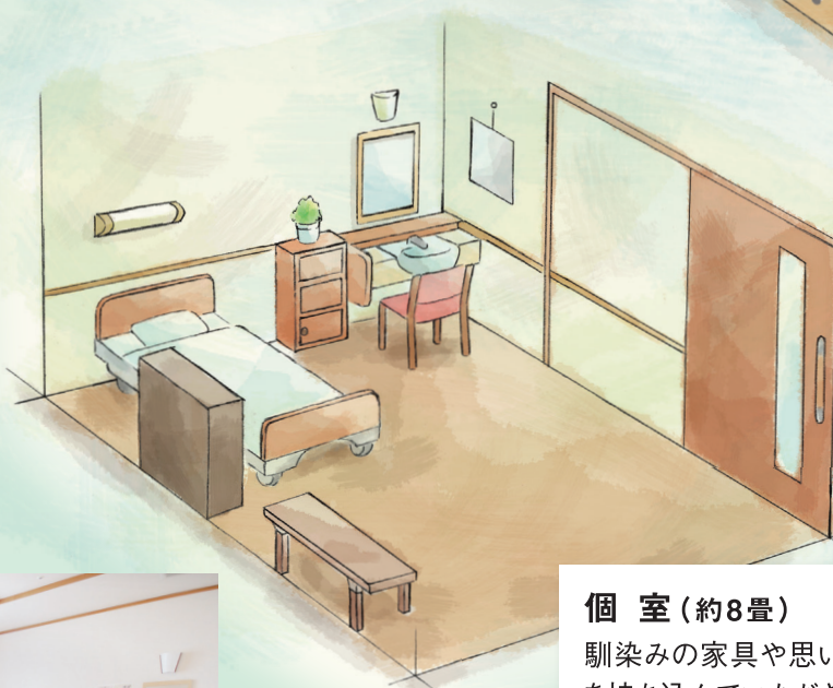
個室(約8畳) 馴染みの家具や思い出の品等を持ち込んでいただき、安心して暮らせる部屋づくりをしています。