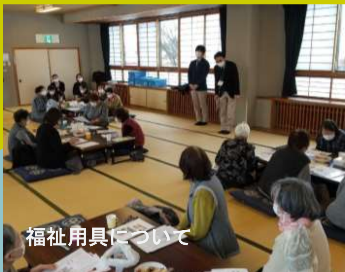
福祉用具について

本日は、介護保険制度について当法人の居宅介護支援センターのケアマネジャーから説明をしていただきました。福祉用具についても説明し、参加者からはどのような状態になったら介護申請ができるのか等、多くの質問がありました。また、健康体操ではみなさんが知っている名曲に合わせてリズムを取りながら、体操を行いました。