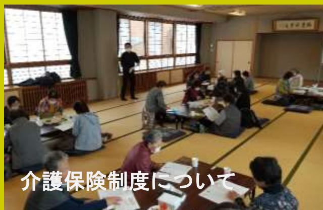
介護保険制度について