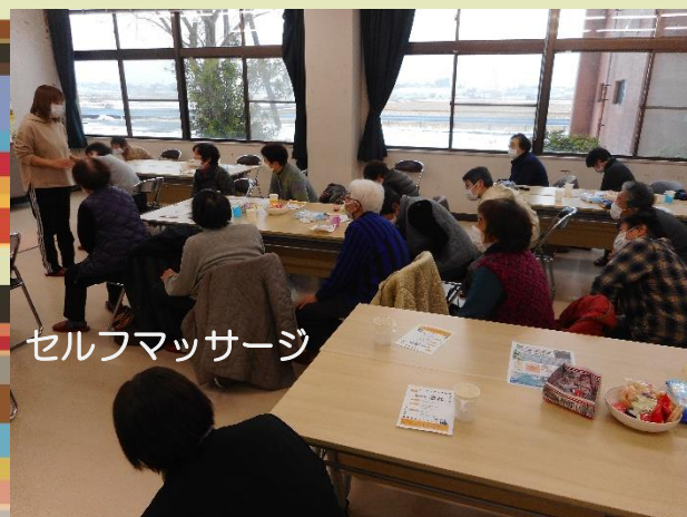
セルフマッサージ

本日は、「筋膜ケア・マッサージ」を開催しました。セルフマッサージや講師からの実践により、参加者からは、「体がポカポカする」と言った声が聞かれていました。また、講師のところへ通われている方からは、血流が良くなり痺れが改善したとの声も聞かれています。筋肉が柔らかくなることで、姿勢の改善することにも期待できます！